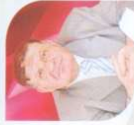
الأستاذ الدكتور جسار الجيار رئيس الجامعة