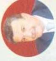
أ.د. عيسى محمد شمس الدين نائب رئيس الجامعة لشؤون خدمة المجتمع وتنمية البيئة