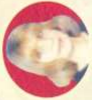
أ.د. سوسن شعراوي جمعة نائب رئيس الجامعة لشؤون الدراسات العليا والبحوث